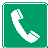
TELÉFONO DE SALVAMIENTO