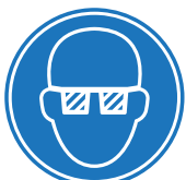
PROTECCIÓN OBLIGATORIA DE LA VISTA