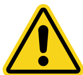
PELIGRO EN GENERAL