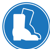
PROTECCIÓN OBLIGATORIA DE LOS PIES