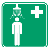
DUCHA DE SEGURIDAD