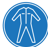
PROTECCIÓN OBLIGATORIA DEL CUERPO