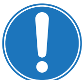
OBLIGACIÓN GENERAL (OBLIGATORIO)