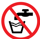
AGUA NO POTABLE