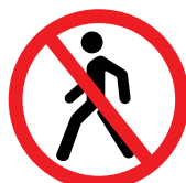
PROHIBIDO EL PASO DE PEATONES