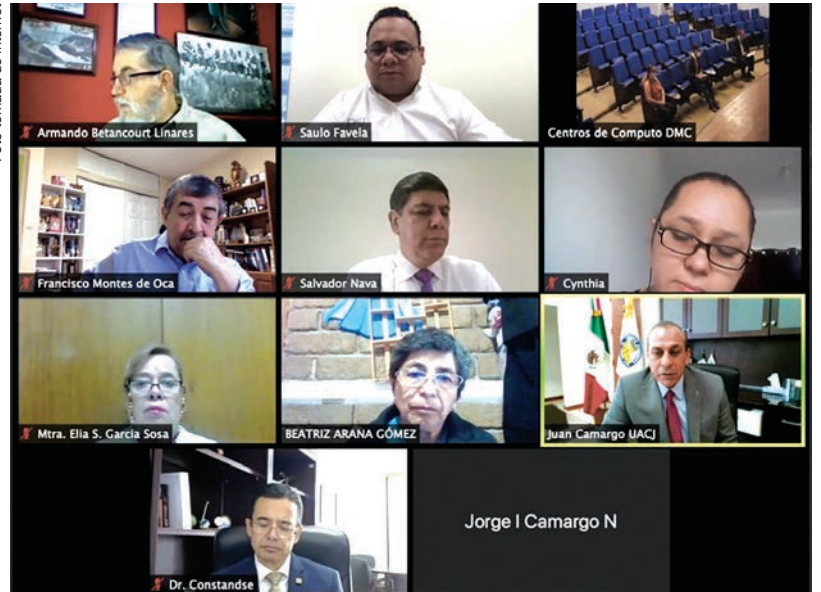
La evaluación del Programa de Enfermería del campus de UACJ en Cuauhtémoc se realizó en línea.