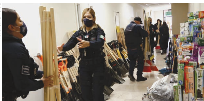
Un total de mil 775 utensilios para limpieza fueron entregados a la Policía Estatal.

za, 253 palas, 259 escobas, 256 rastrillos, 253 recogedores y 477 cajas de bolsa para basura.