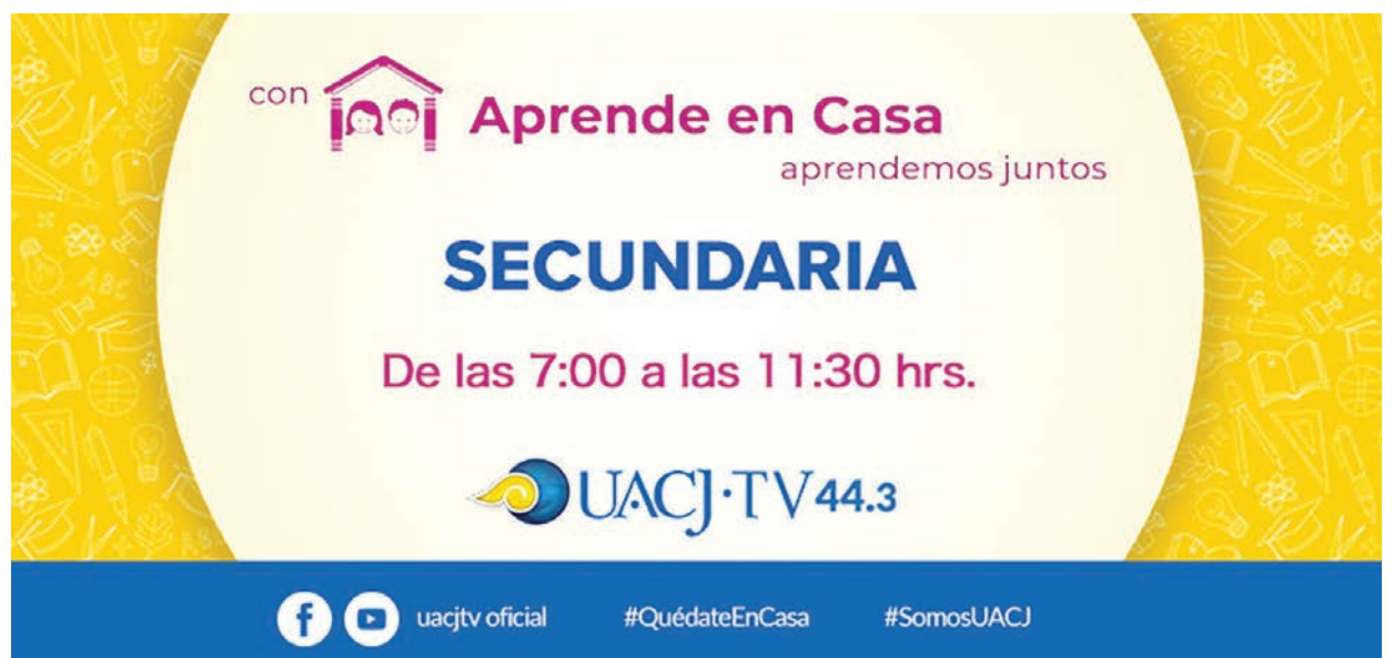
El canal universitario apoya el programa “Aprende en Casa” con la transmisión de clases para los alumnos de educación básica.

universitaria ha propuesto contenido educativo y cultural de alta calidad, logrando consolidarse como una opción no sólo para los universitarios sino para toda la comunidad fronteriza.