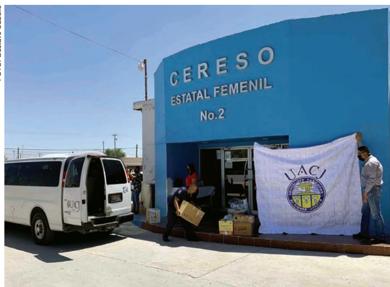
Representantes de la comunidad universitaria llevó el donativo al Cereso Estatal Femenil #2.

Dirección General de Extensión y Servicios Estudiantiles, fue a principios de este 2020, cuando además se impartieron algunos talleres de manualidades.