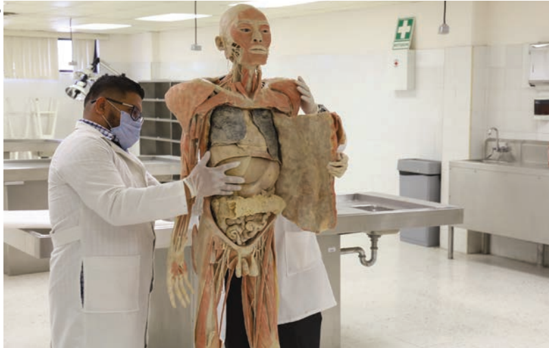
Docentes muestran características del cuerpo plastinado.