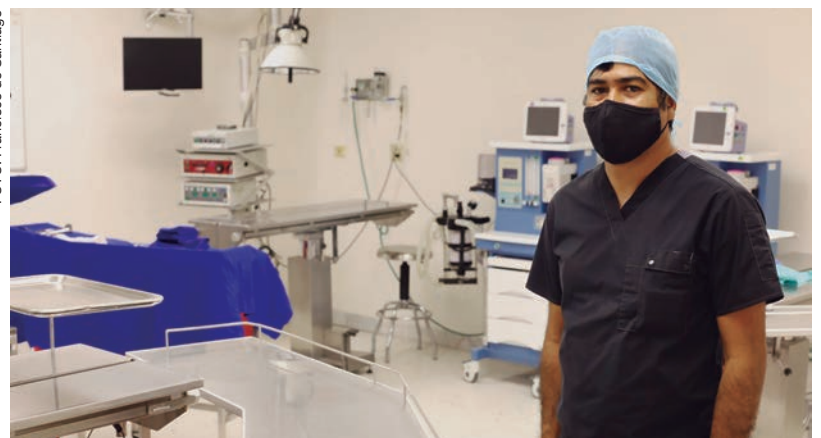
En el Centro de Entrenamiento Quirúrgico se estarán grabando en video cirugías.

bulto, el vestido de los integrantes, del cirujano, el anestesista e instrumentista”, explicó Hernández.