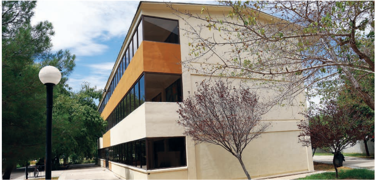
Edificio del Centro de Lenguas, en el Instituto de Ciencias Biomédicas.