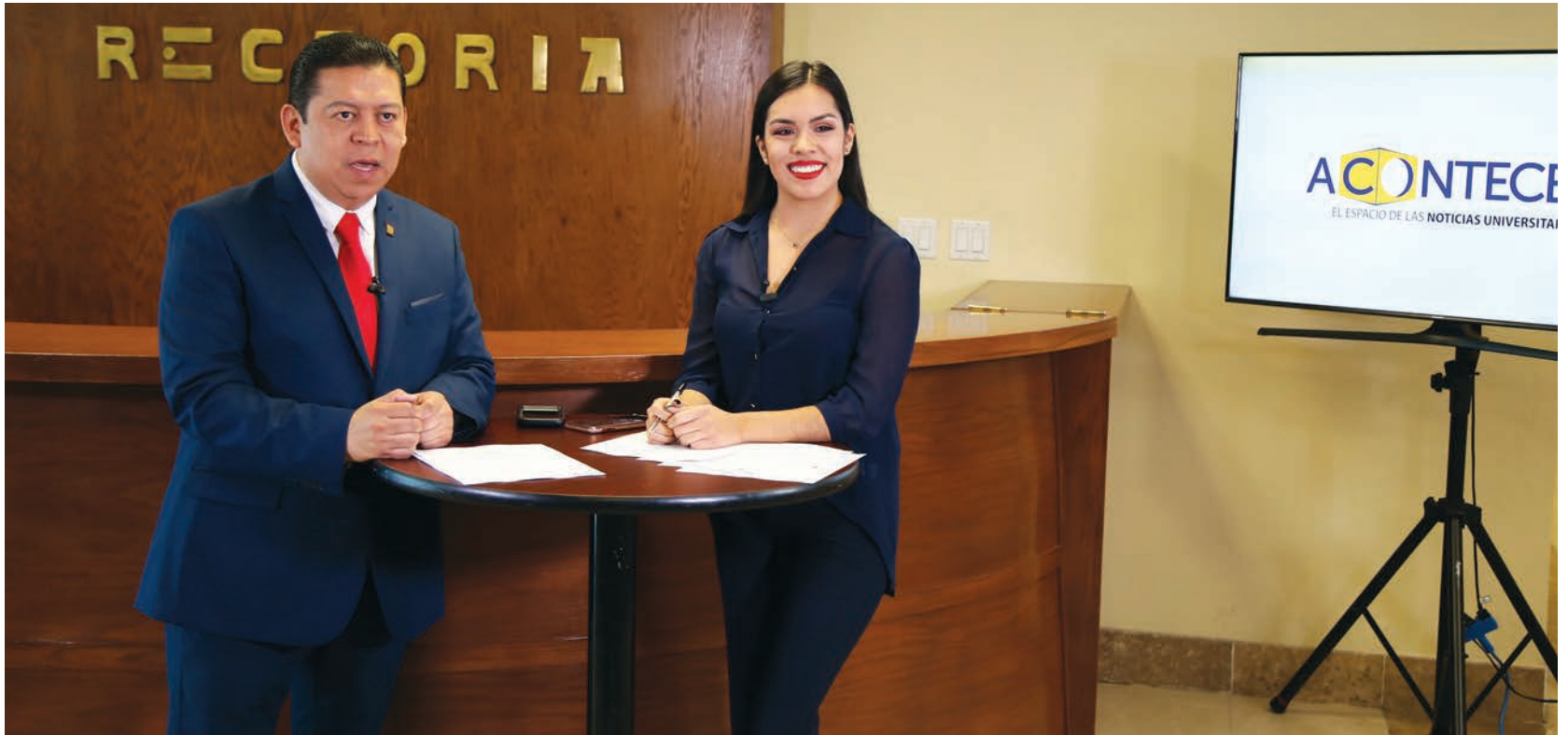
A través de Acontecer, se informa a la comunidad de los hechos más sobresalientes en la Universidad.