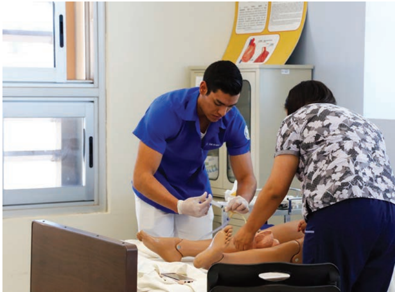
Los alumnos de Enfermería realizan sus prácticas en maniqués.