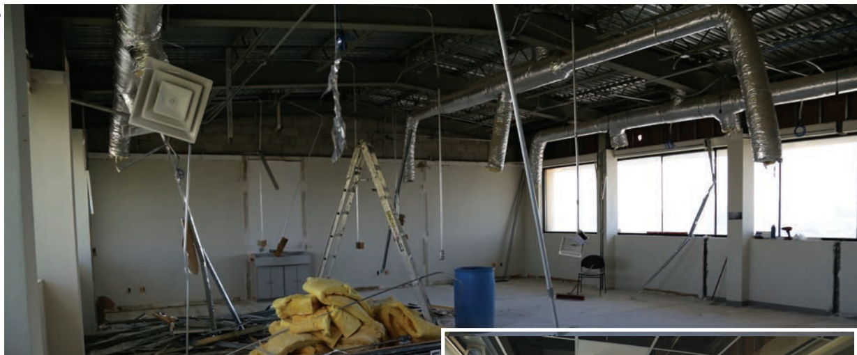
En el tercer piso del edificio se habilitarán aulas en el espacio que ocupaban los cubículos.