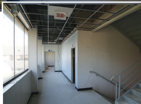
Se iniciaron en el ICB los trabajos de remodelación del edificio Q.

muebles, las lámparas y se impermeabilizará completamente.