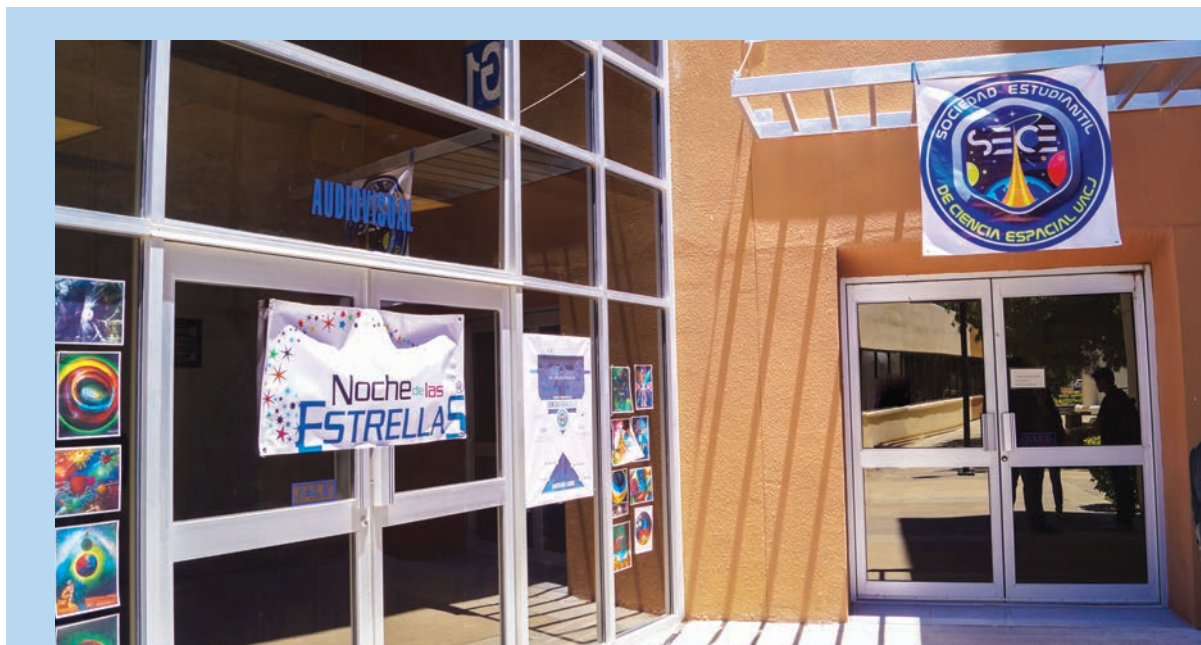
La imagen corresponde a uno de los eventos presenciales que la Sociedad Estudiantil de Ciencia Espacial ha organizado.

Agregó que el campo magnético de Marte se enfrió hace 4 mil millones de años, y que sería necesario de mucho esfuerzo para conseguir derretirlo, o incluso diseñar uno de