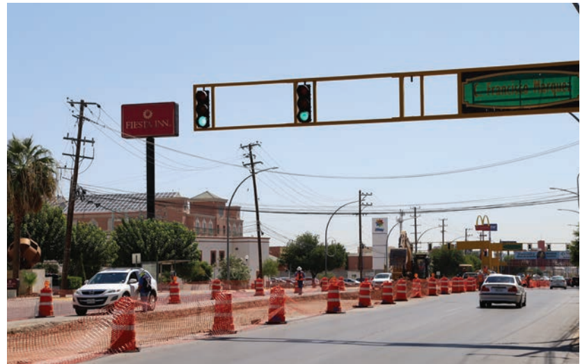
Trabajos que se realizan en Paseo Triunfo de la República para la construcción de la Ruta Troncal del Transporte Público.