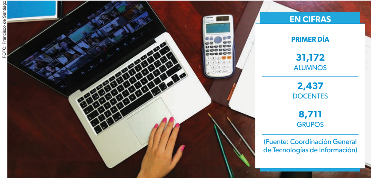
Con el apoyo de plataformas digitales se iniciaron las clases de manera virtual en la UACJ.

que las inscripciones recientes se actualizaron en el curso del día y al día siguiente estarían dados de alta en la plataforma Teams.