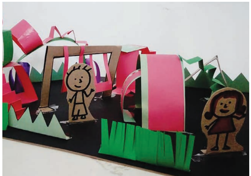
Los talleres virtuales que se ofrecieron en el Campamento de Verano tuvieron una audiencia binacional. En la foto de la derecha se tiene una de las manualidades que se elaboraron en uno de los talleres.