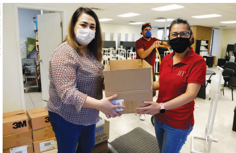
La administración de la UACJ distribuyó en todos sus institutos materiales de protección para prevenir contagios.