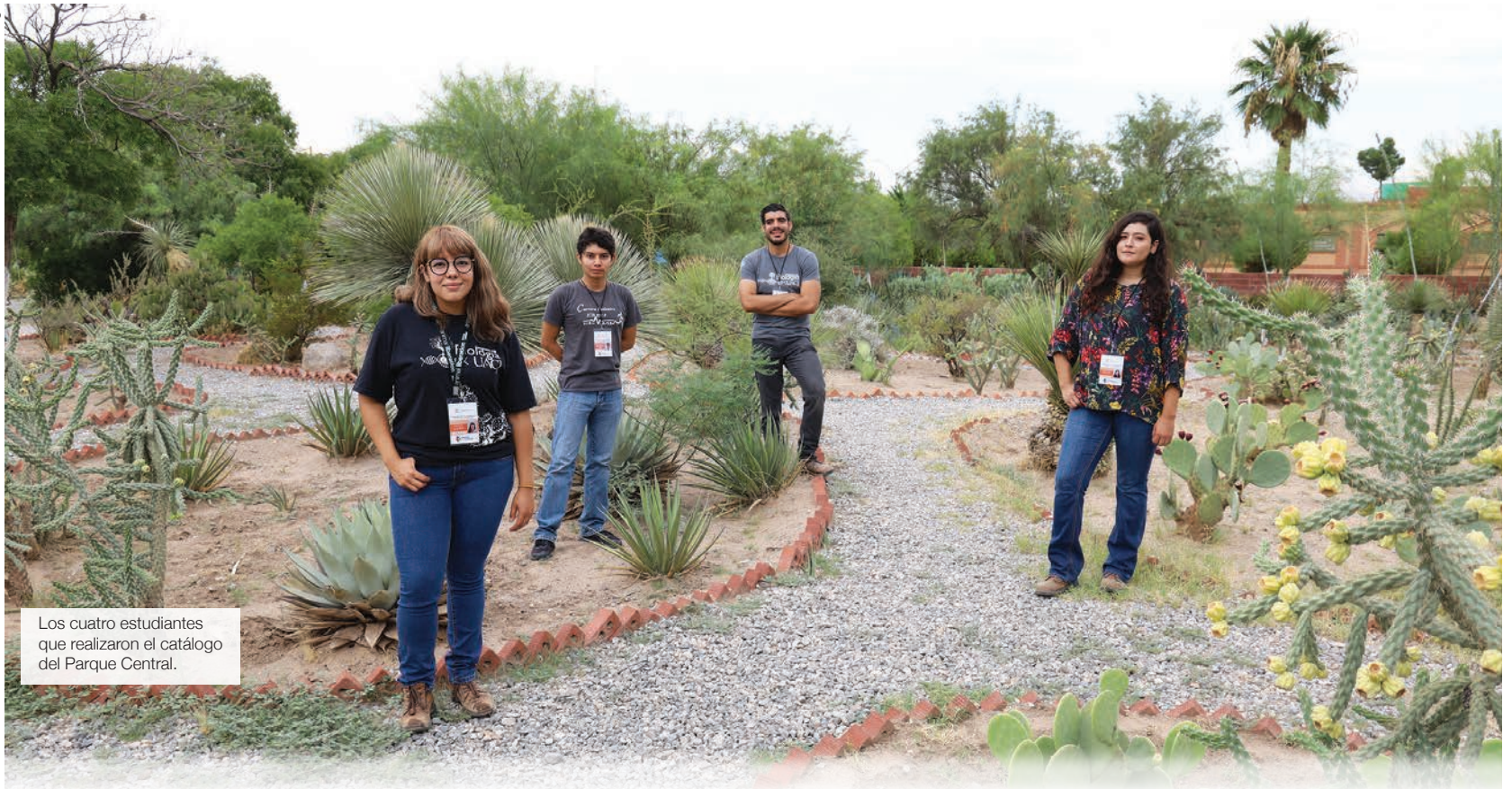
Los cuatro estudiantes que realizaron el catálogo del Parque Central.