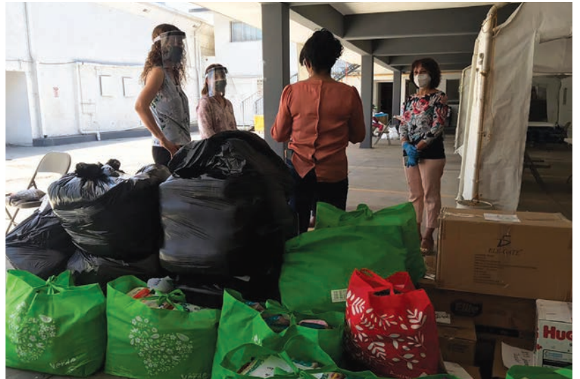
Más de cinco mil artículos de higiene y alimento para bebés fueron donados por estudiantes universitarios a los migrantes que se encuentran en el hotel filtro de esta ciudad.