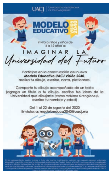
Cartel de la convocatoria dirigida a los niños.

Para participar en esta consulta, con previa autorización de sus padres o tutores, los niños y niñas deberán enviar su opinión al correo modeloeduca2040@uacj.mx .