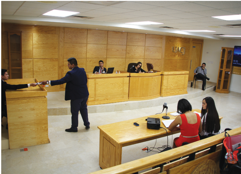
Los equipos de estudiantes contendieron con un mismo caso de homicidio.