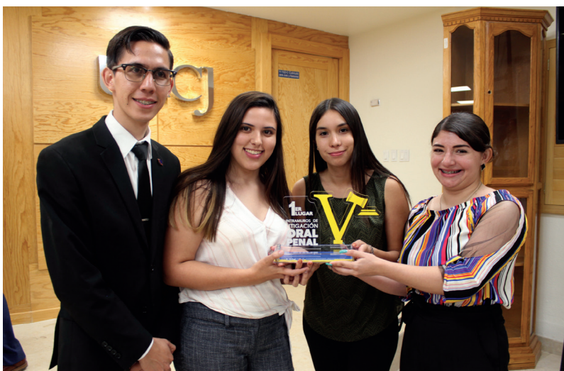
Los ganadores representarán a la universidad en competencias regionales y nacionales.

veles intermedio y avanzado de la Licenciatura en Derecho. De este concurso se elegirá a quienes representen a la Universidad Autónoma de Ciudad Juárez en los certámenes regional y nacional.