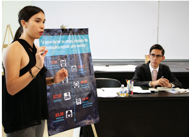
Las sesiones se realizaron en diferentes espacios del ICESA.