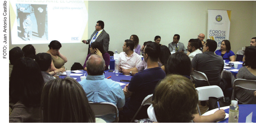
Las actividades en una de las mesas de trabajo.

Otro de los temas que se expresaron en estas mesas fue la necesidad de una democratización de la educación superior, cambiar los paradigmas del modelo educativo que se ve afectado por el desarrollo de las nuevas tecnologías de comunicación, así como la capacidad de innovar en un trabajo colaborativo