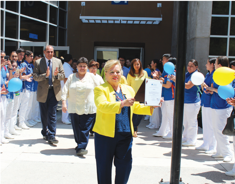
La coordinadora de Enfermería muestra a estudiantes el documento de acreditación