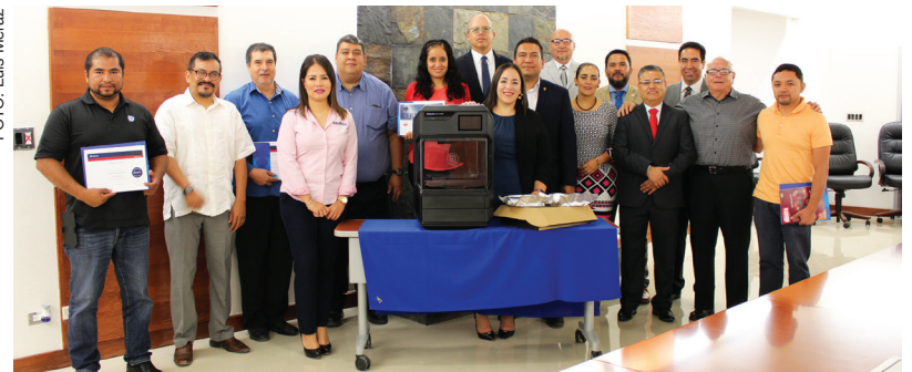
Intelligy, la empresa orientada a consultoría industrial obsequió el equipo a la universidad.

compañías, alumnos, profesores y egresados significará tener una mayor vinculación con la sociedad, al ofrecerle una mayor competitividad a la región.