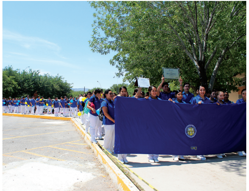
Celebran estudiantes el reconocimiento a la calidad del programa.