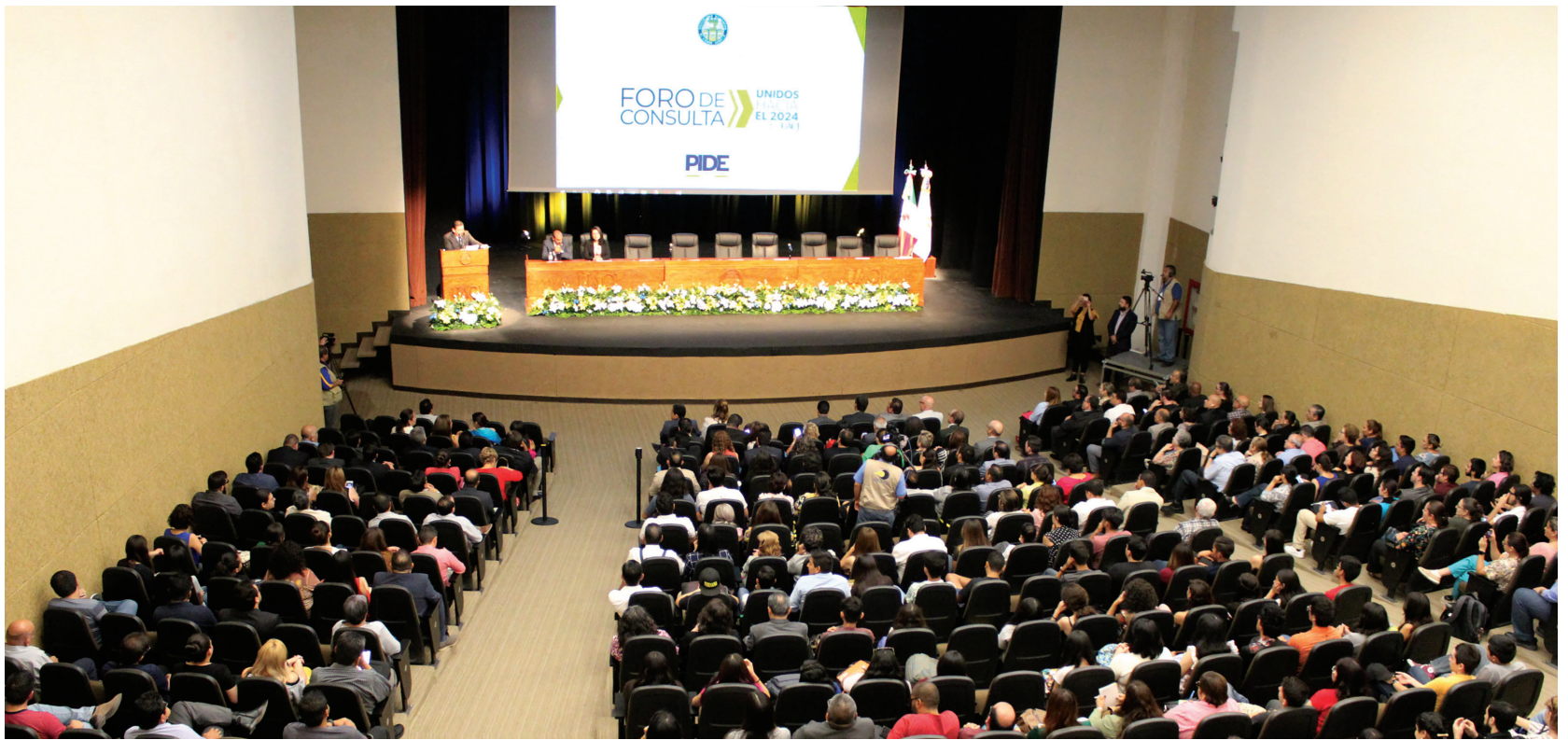
Durante dos días se realizó el foro de consulta en el que participaron casi mil 300 personas.