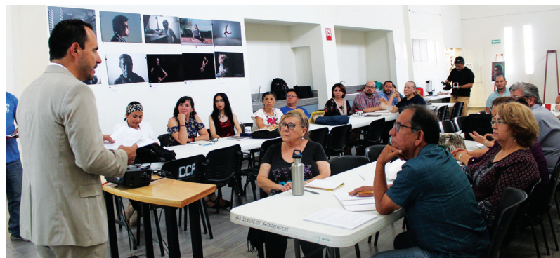
Inició seminario de desarrollo cultural comunitario.