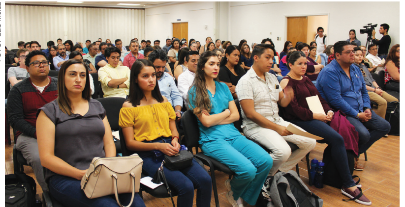
Alumnos trabajaron con investigadores de la Universidad.