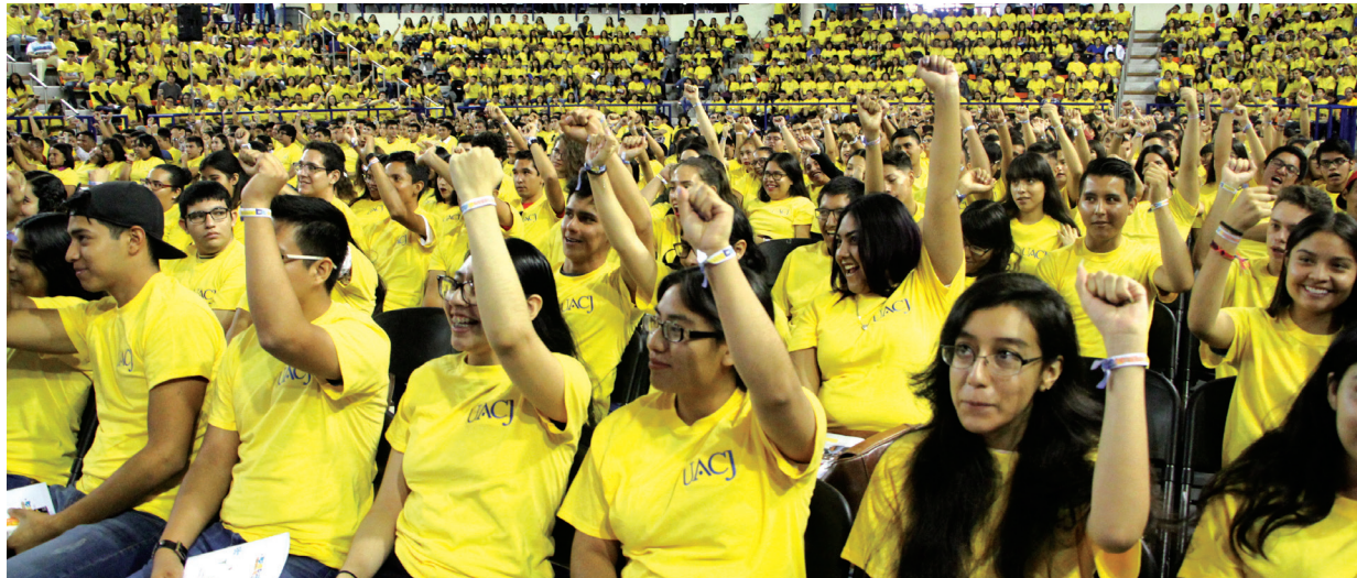
Los nuevos integrantes de la comunidad UACJ se reunieron en el Gimnasio Universitario.

to de bienvenida y dejando atrás el discurso de más funcionarios, se dio lugar a la presentación de alumnos que representan a la UACJ en el ámbito deportivo, cultural y de extensión.