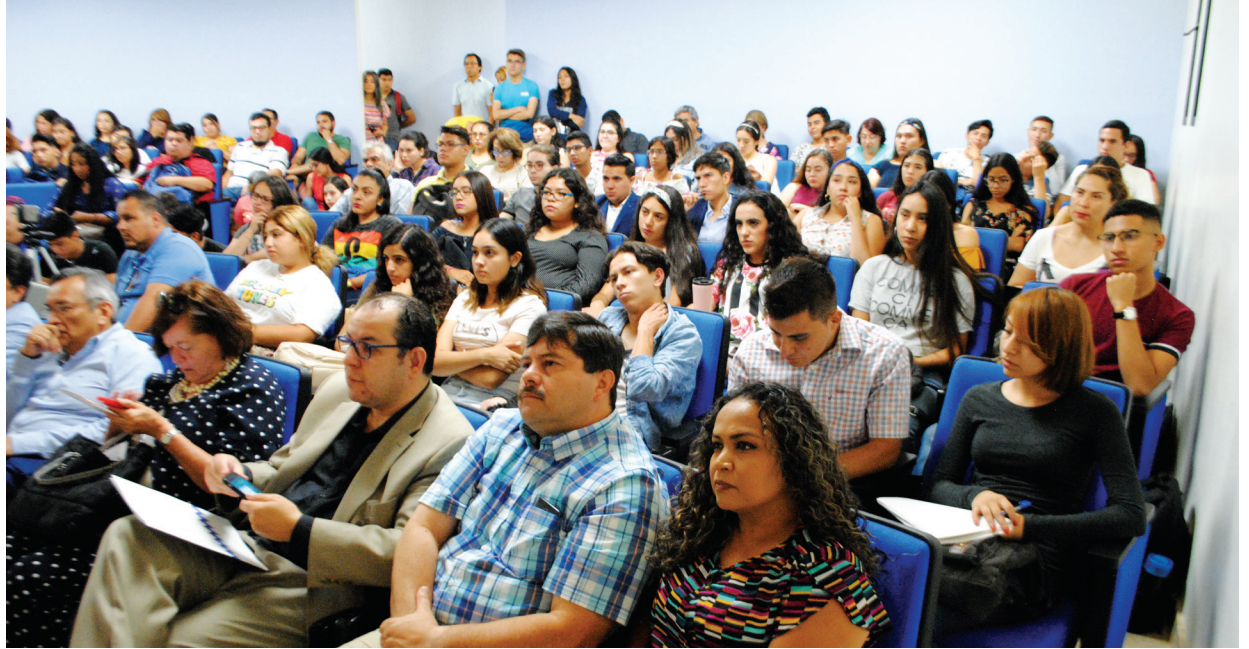
Estudiantes y docentes de Ciencias Sociales asistieron a conferencia de Pablo Yanes Rizo.

El funcionario de la Comisión Económica para América Latina y el Caribe dijo que el actual modelo de desarrollo se encuentra agotado y que no es sólo un problema de ajuste de políticas, sino que es un problema de la concepción, de la orientación