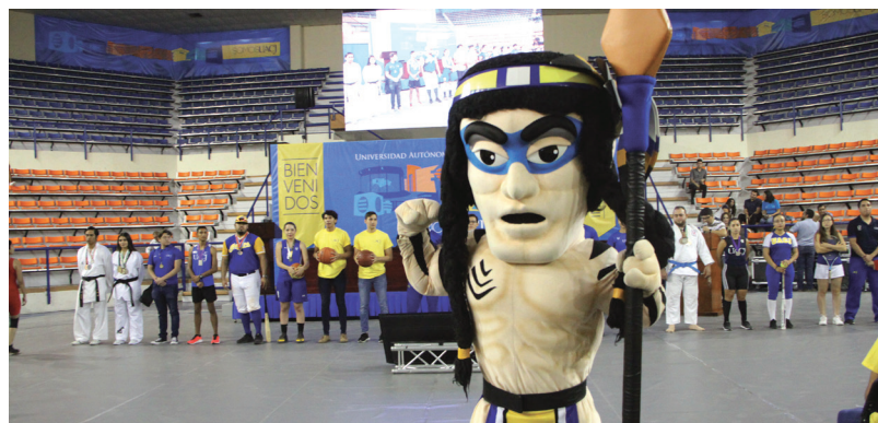
Los exhortan a participar en los grupos representativos de esta casa de estudios.