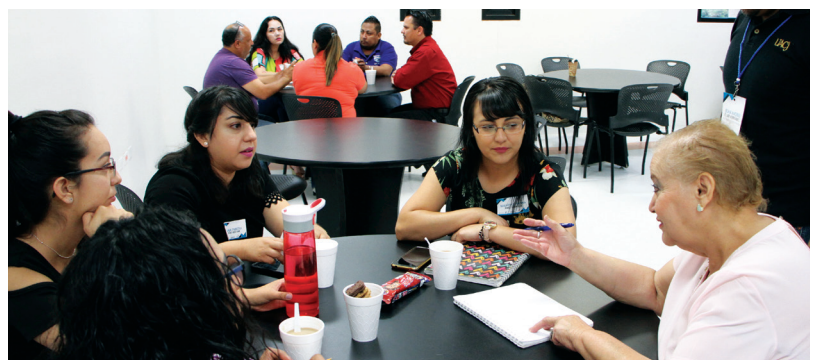
Una de las mesas de trabajo para el análisis del rezago educativo.

con practicantes o con los mismos maestros con metodologías y talle-