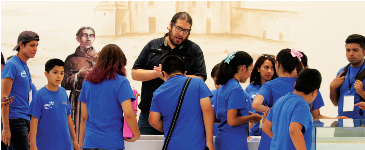
En una de las actividades del PERAJ se realizó una visita a museos.