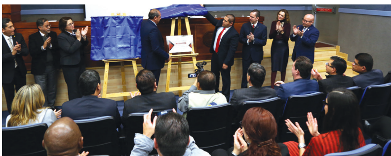
Develan placa conmemorativa en auditorio de CU.

cinco años el Programa de Comercio Exterior que se imparte en Ciudad Universitaria. El representante del organismo acreditador dijo que CONACI es el único consejo que ha sido formado por una alianza entre la empresa y la academia con el objetivo de generar recursos humanos que atiendan este sector de la economía.