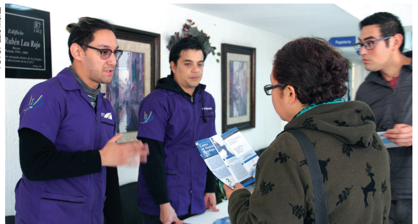
Alumnos de Psicología brindan información sobre la atención que se ofrece en el SURE.

versidad cuenta con el SURE y para las actividades culturales y artísticas se tiene el centro de Bellas Artes, la librería universitaria y el Programa de Artes y Oficios.