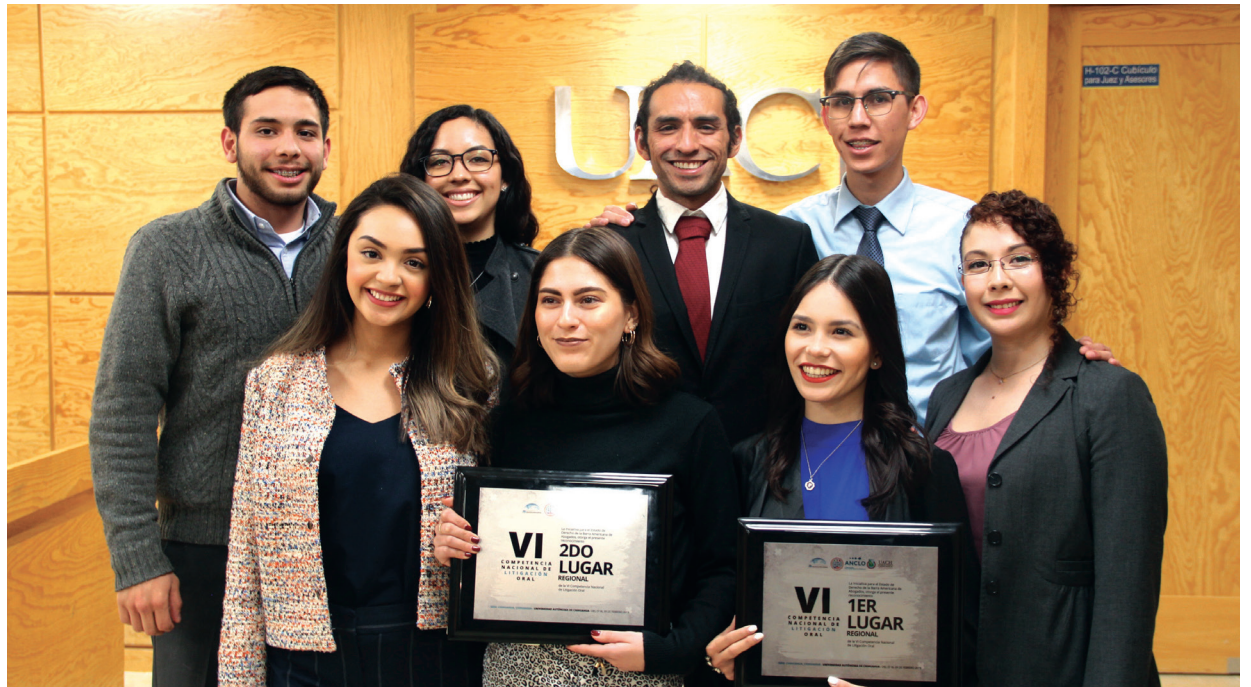
Los integrantes de los equipos ganadores recibieron un reconocimiento.