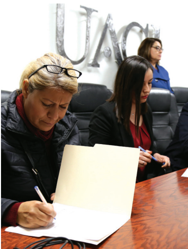
Representantes de instituciones firman convenio con la universidad.