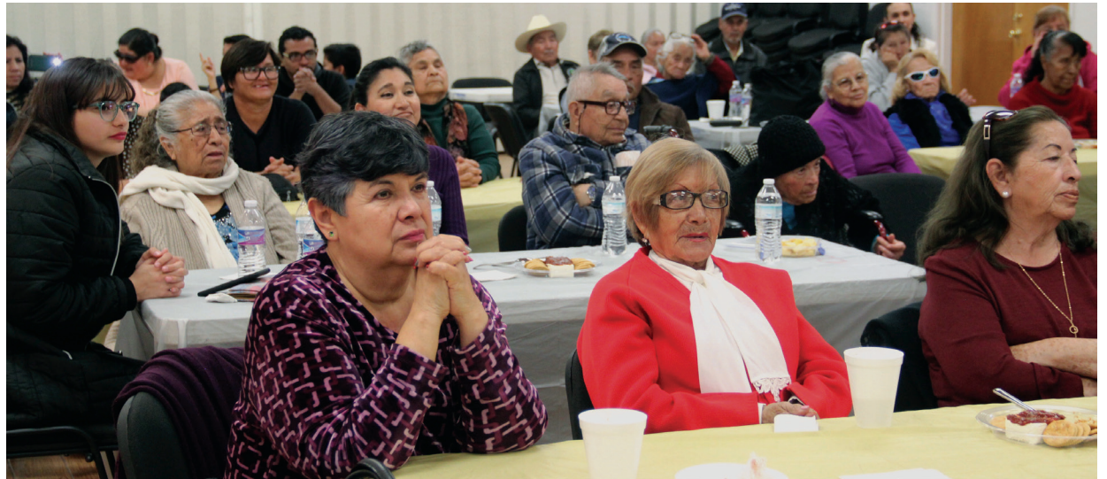
Adultos mayores que participaron en la iniciativa estudiantil.