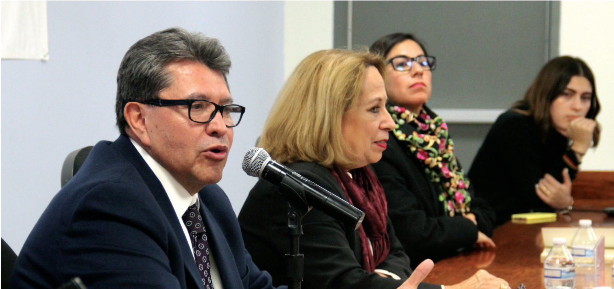
El legislador de Morena durante la presentación de "El Acceso de las mujeres a la justicia".