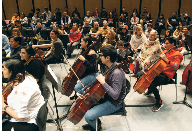
Entre el público, los jóvenes músicos interpretaron a Mozart y Vivaldi.