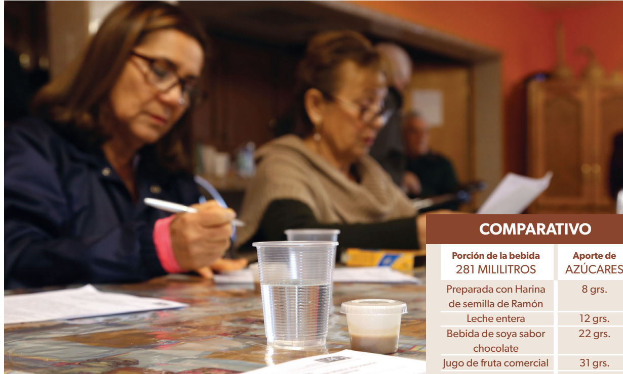
Personas del centro de jubilados del SNTE ingieren la bebida.

realizado como parte complementaria de las investigaciones de la doctora Martínez, se encontró que tiene un importante contenido en proteínas y fibra dietética, al igual que en minerales, calcio, zinc, magnesio, potasio, ácido fólico, y además es considerado 100 por ciento libre de gluten, lo cual hace que se considere como un atractivo recurso de la biodiversidad mexicana a incorporarse en nuestra alimentación, ya que actualmente es un recurso natural subutilizado.