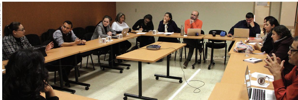
En la sesión participan profesores de diferentes instituciones educativas, funcionarios públicos y representantes de organizaciones civiles.