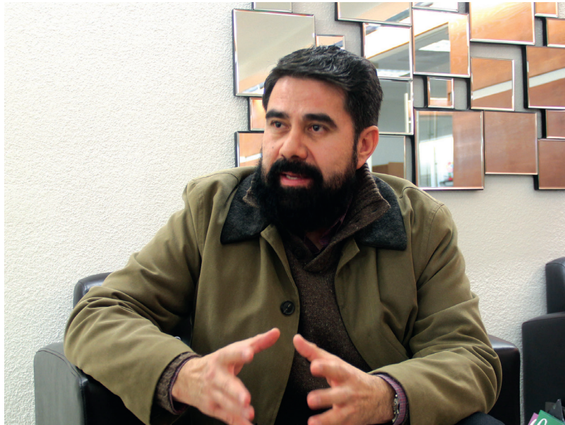
El profesor de IIT explicó el proceso que siguió para cumplir con la encomienda.

nología platicó a Gaceta que esta oportunidad surgió durante el Congreso Internacional de Investigación en Materiales (IMRC) que cada año organiza la Sociedad Mexicana de Materiales en Cancún, en donde toma la iniciativa y con el respaldo de un grupo de editores, sugiere a la sociedad norteamericana realizar un número especial con los temas abordados en el simposio que forma parte del congreso. Esta propuesta fue bien recibida, ya que los proponentes son muy reconocidos en el área de catálisis.