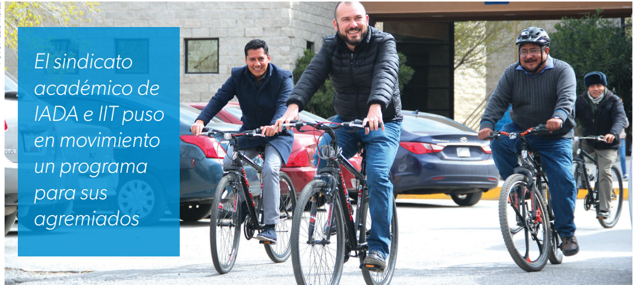
Docentes pueden usar bicicletas para sus traslados a los diferentes institutos.

El sindicato académico de IADA e IIT puso en movimiento un programa para sus agremiados