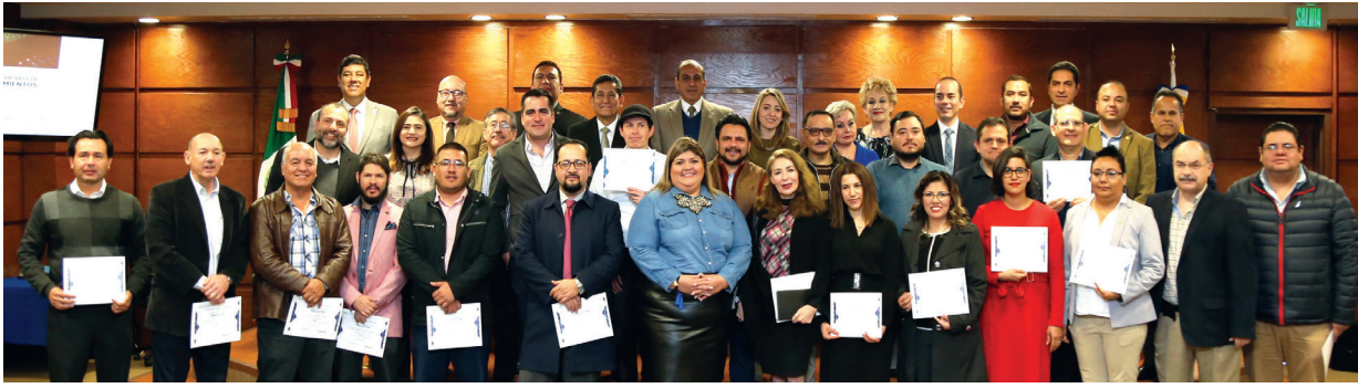
Autoridades universitarias y algunos de los profesores que son reconocidos por el Sistema Nacional de Investigadores.