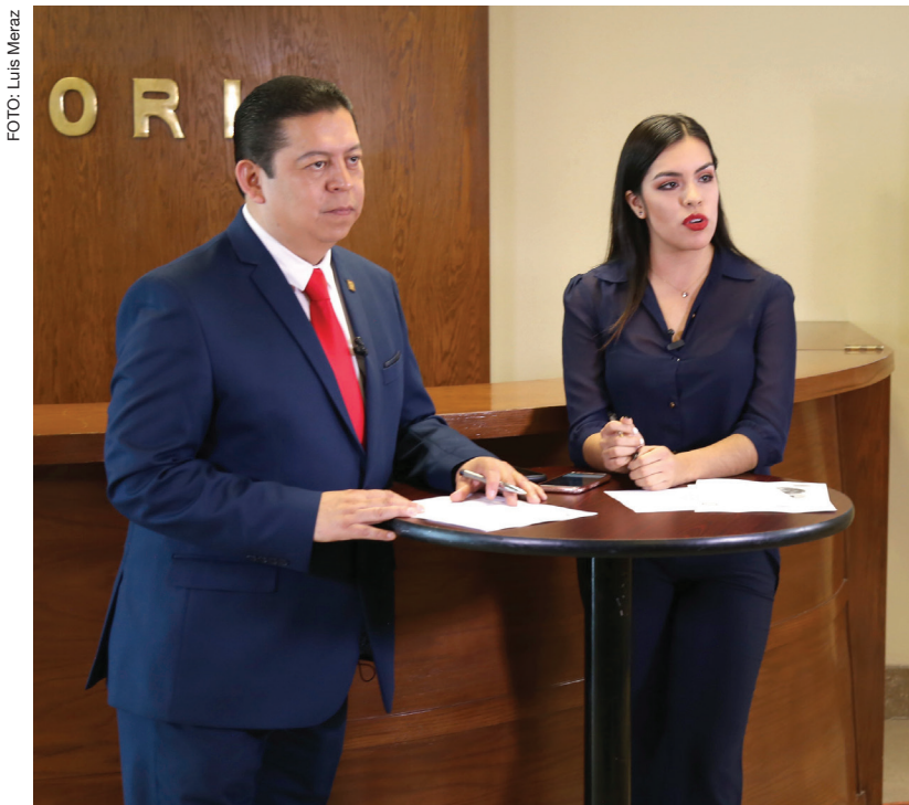
Desde el vestíbulo de la rectoría fue la primera emisión.

Con la finalidad de llevar información relevante y al momento a la comunidad universitaria y juarense, la Universidad Autónoma de Ciudad Juárez inauguró el 15 de febrero el noticiero semanal Acontecer, con duración de 30 minutos.