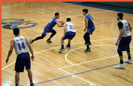
El jugador número 12 de UACJ intenta penetrar la defensa del ITCH.