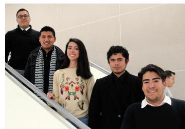
Los estudiantes que representarán a UACJ en otras competencias.