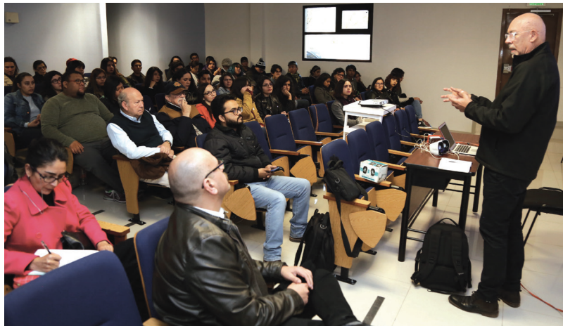
Santiago Espinosa de los Monteros exhortó a estudiantes a no copiar a los autores consolidados.

estructurar una pieza y solo así romper esquemas. Sostuvo que en los últimos 15 años ha prevalecido el trabajo de quienes en su primera época tuvieron una estructura que